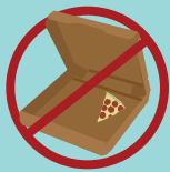
PIZZA BOXES CAJAS DE PIZZA