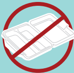
STYROFOAM POLIESTIRENO EXPANDIDO