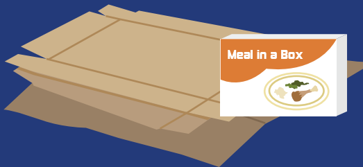
FLATTENED CARDBOARD CARTÓN APLANADO