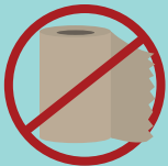
PAPER TOWELS TOALLAS DE PAPEL