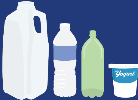
PLASTICS #1 - #7 PLÁSTICOS #1 - #7