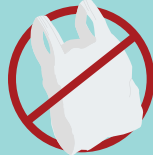
PLASTIC BAGS BOLSAS DE PLÁSTICO