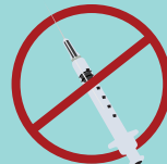
SHARPS OBJETOS AFILADOS