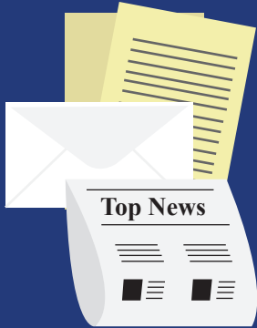
PAPER (MIXED & OFFICE) PAPEL (MEZCLADO & DE OFICINA)