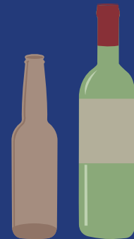
GLASS BOTTLES & JARS VIDRIO (JARROS Y BOTELLAS)