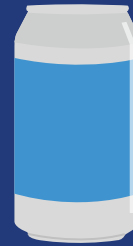
ALUMINUM CANS LATAS DE ALUMINIO