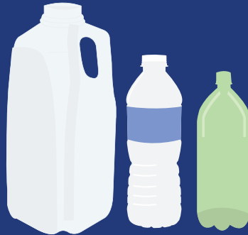
PLASTICS #1 & #2 PLÁSTICOS #1 & #2