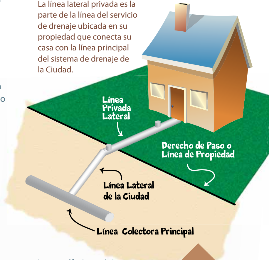
Imagen modificada, cortesía de St. Petersburg, Florida

La línea lateral privada es la parte de la línea del servicio de drenaje ubicada en su propiedad que conecta su casa con la línea principal del sistema de drenaje de la Ciudad.