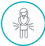
ပြင်းထန်သော ဝိုက်နာခြင်း