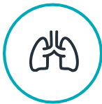
အသက်ရှူရခက်ခြင်း