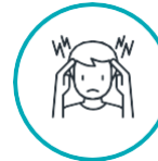
ရုတ်တရက်မူးဝေမှု