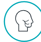
မျက်နှာတစ်ခြမ်း ညွတ်ကိုင်ခြင်း

သင် သို့မဟုတ် သင်သိသော တစ်စုံတစ်ယောက်က စိတ်ခံစားချက်ဆိုင်ရာ အကူအညီ လိုအပ်နေပါက သို့မဟုတ် စိတ်ပိုင်းဆိုင်ရာ ကျန်းမာရေး ကပ်ဘေးကို ကြုံတွေ့နေရပါက 512-472-အကူအညီ (4357)၊ Integral Care ၏ 24/7 အကူအညီဖုန်းလိုင်းကို ခေါ်ဆိုပါ။