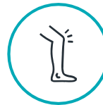
ခြေလက် တစ်ချောင်း သို့မဟုတ် တစ်ချောင်းအထက် ရုတ်တရက် ထုံထိုင်းသွားမှု သို့မဟုတ် အားနည်းမှု