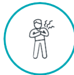
ရင်ဘတ်အောင့်ခြင်း