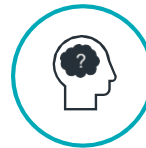
ထိတ်လန့်တကြားဖြစ်မှု