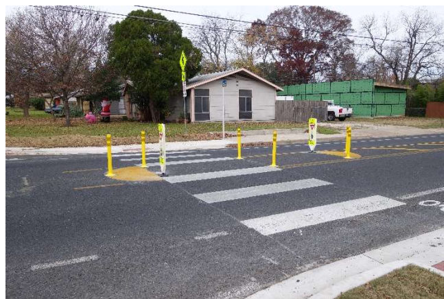
Examples of protected bicycle lane constructed using flexible posts (“flex posts”) on Manor Rd (left), and a pedestrian crossing island on Berkman Drive (right)

A preliminary design will be available at the project open house for your review and feedback. We look forward to seeing you at the project open house on Tuesday, March 24, or hearing from you through the project survey. The survey and open house materials will be available online starting on March 24. The survey will be open through Sunday, April 26. Visit the project website for more information and updates: austintexas.gov/ ParkfieldDrive or austintexas.gov/ActiveTransportationProjects