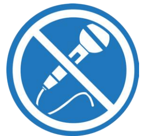
မိုက်ခရိုဖုန်းများကို မမျှဝေပါနှင့်