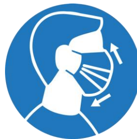
မျက်နှာအကာ အကွယ်ကို ဝတ်ဆင်ပါ