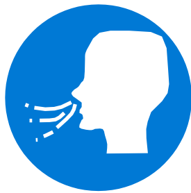
နာလေ (သို့မဟုတ် သီချင်းဆိုခြင်း)