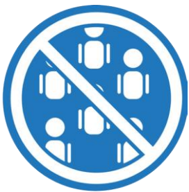
လူအုပ်စုကြီးများကို ရှောင်ပါ