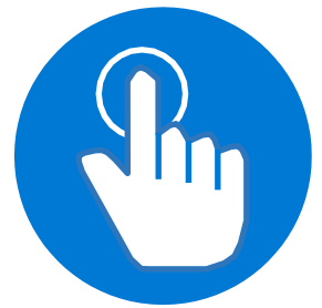
ထိတွေ့မှု