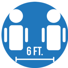
အနည်းဆုံး 6 ပေခွာ၍ နေပါ