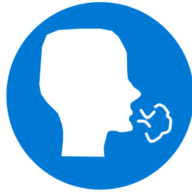
ချောင်းဆိုးခြင်း