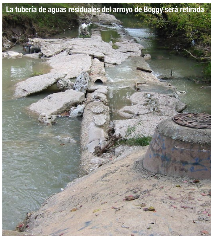
La tubería de aguas residuales del arroyo de Boggy será retirada