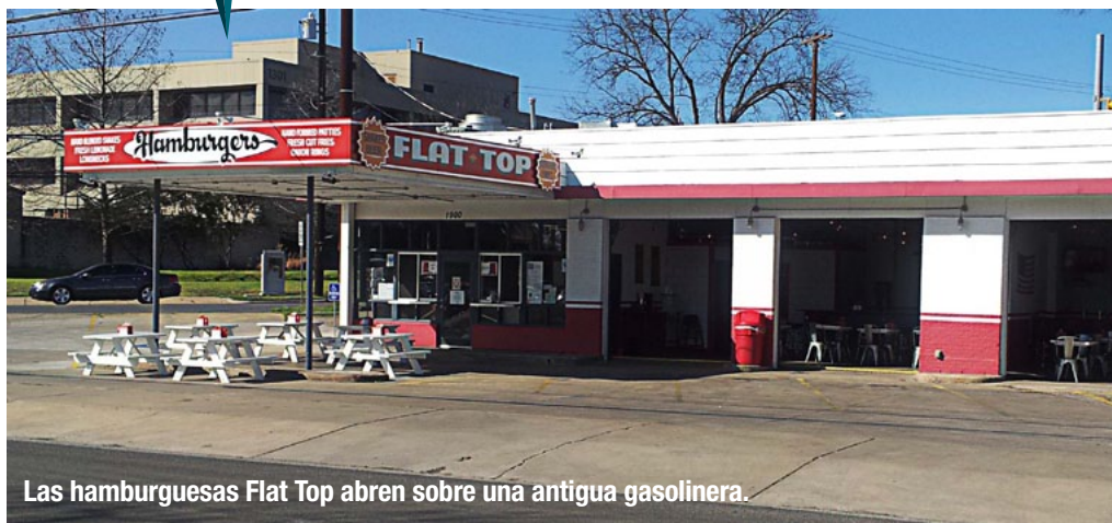
Las hamburguesas Flat Top abren sobre una antigua gasolinera.